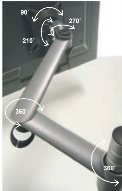
*flexible movement joints and full reach of 440mm Max.

Zorroは、耐久性に優れたアルミダイカストとグラスフィールドナイロンプラスチックで構成された、VESA対応の液晶モニターです。オプションで各種ブラケットをご用意していますので、あらゆる場所に取付け可能です。